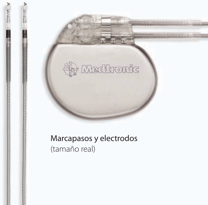
Marcapasos y electrodos (tamaño real)

* El sistema de estimulación Revo MRI™ SureScan® es condicional a las resonancias magnéticas y está diseñado para permitir que los pacientes se sometan a una MRI bajo las condiciones especificadas de uso. El sistema completo, consistente de un Medtronic Revo MRI SureScan IPG implantado con dos cables CapSureFix MRI® SureScan es necesario para usarse en el ambiente MRI.